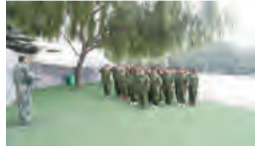
穿上迷彩服,扎起武装带,听教官的口令完成训练动作,喊着口号唱着军歌,在夏末秋初的骄阳

下挥洒汗水,在这里参加军训的不是普通院校的新生,而是我院2016级住院医师规范化培训的学员。